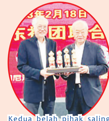
Kedua belah pihak saling bertukar cenderamata.