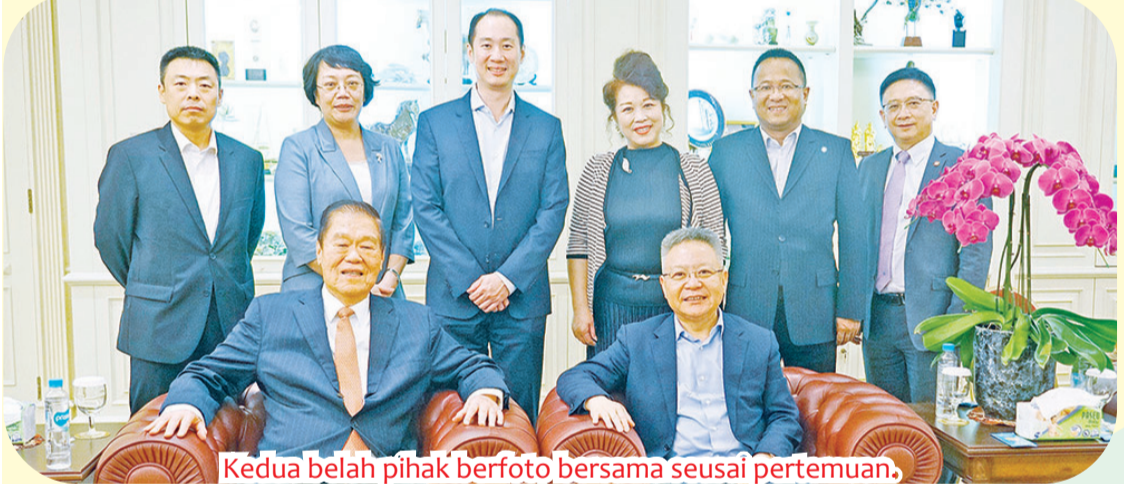
Kedua belah pihak berfoto bersama se usai pertemuan.

Hainan Free Trade Port akan memimpin dalam mendorong kerja sama persahabatan antara Tiongkok dan Indonesia. • jhk/din