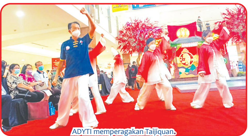
ADYTI memperagakan Taijiquan.

"Bela diri Wing Chun populer berkat film IP Man. SWCA yang berdiri sejak 2012, kini telah memiliki 100 murid. Kami rutin tampil di sejumlah tempat, termasuk mall dan pusat perbelanjaan, untuk mempromosikannya," ujarnya. • anto tze