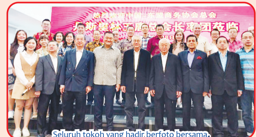
Seluruh tokoh yang hadir berfoto bersama.

JAKARTA (IM) - Perkumpulan Persatuan Guangdong Indonesia, Sabtu (17/2) lalu menyambut hangat kunjungan Delegasi China-ASEAN Business Association (CABA) di Gedung Perkumpulan Persatuan Guangdong Indonesia Jakarta. Ketua Umum Perkumpulan Persatuan Guangdong Indonesia