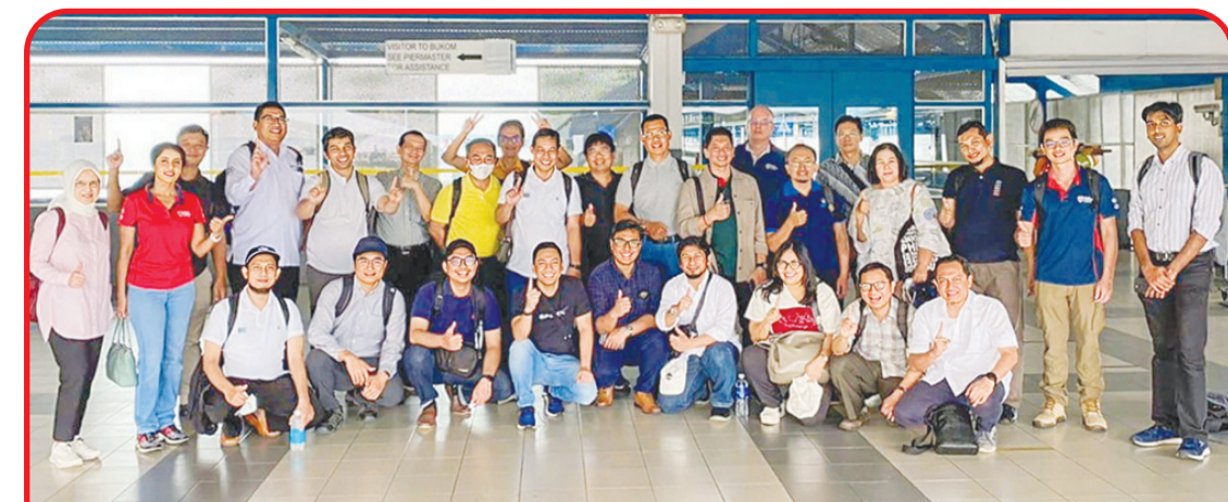
Para pimpinan dan peneliti ITS dan perguruan tinggi lainnya saat mengunjungi Living Laboratory Renewable Energy NTU di Pulau Semakau, Singapura.