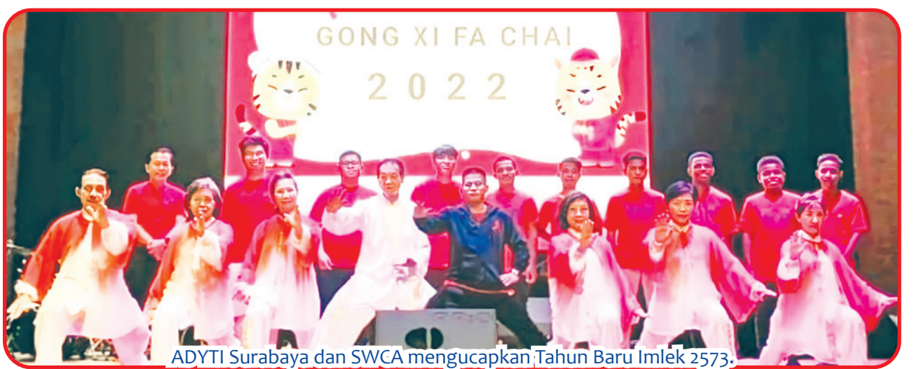
ADYTI Surabaya dan SWCA mengucapkan Tahun Baru Imlek 2573.